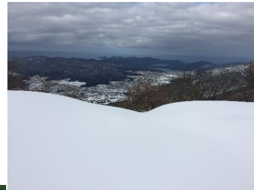
三方五湖が見えます