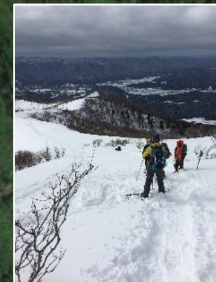
三十三間山からの眺望