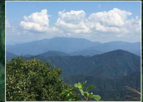
頂上から見た白山