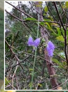
ツリガネニンジン