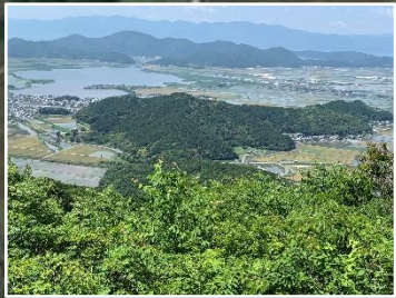
織山から西の湖を望む

JR 能登川駅→猪子山→雨宮龍神社→織山(昼食)→北腰越織山登山口 (距離 6.3km、約 5.5 時間：昼食、休憩含む) 梅雨の晴れ間の好天に恵まれ、気持ちがいい山歩きでした。歴史のある観音や神社があり、可憐な花にも出会えました。 遠くに琵琶湖や比良の山々や田園風景も見渡せて絶景が楽しめました。