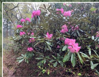
咲き誇るシャクナゲ